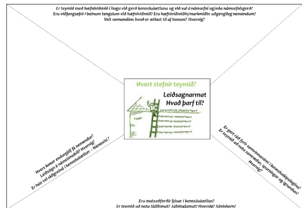
Mynd 6. Verkfæri til að kortleggja stöðu leiðsagnarmats í teymi