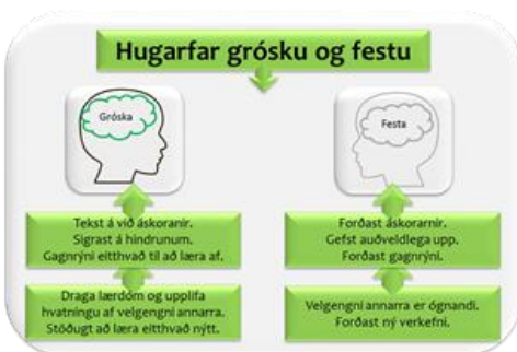
Mynd 4. Hugarfar grósku og festu