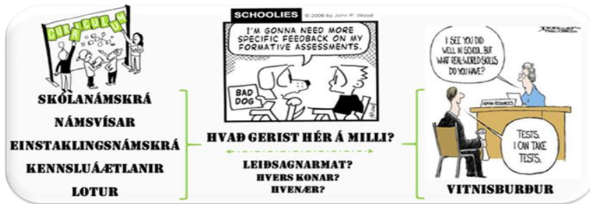
Mynd 1. Námsmat á mörkum skólastiga